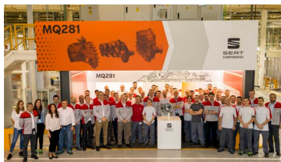
La boîte de vitesses MQ281 sera fabriquée à l'usine El Prat de Llobregat